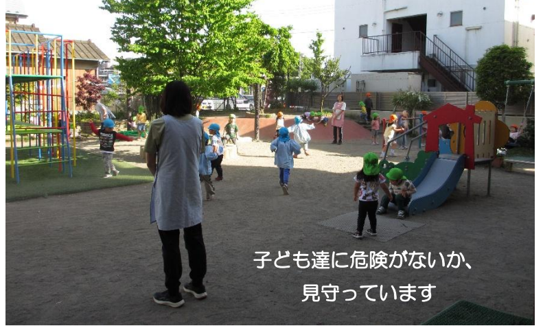
子ども達に危険がないか、 見守っています