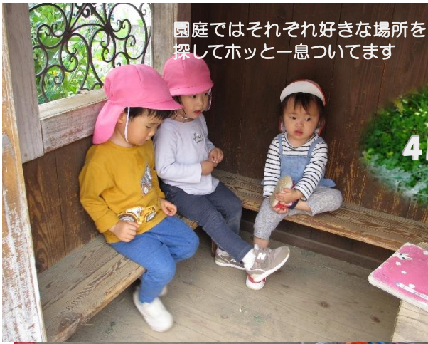
園庭ではそれぞれ好きな場所を探してホッと一息ついてます