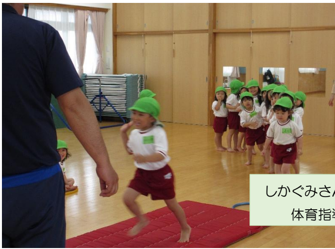
しかぐみさん、初めての 体育指導でした