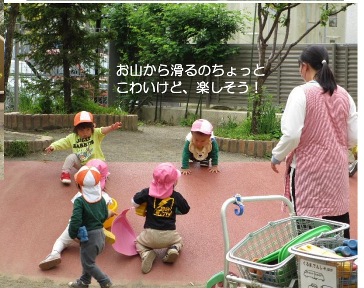
お山から滑るのちょっと こわいけど、楽しそう！