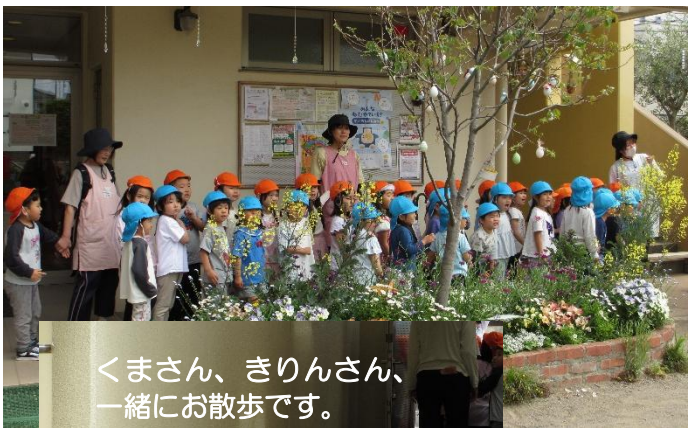
くまさん、きりんさん、 一緒にお散歩です。 「いってらっしゃーい」