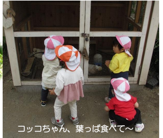
コッコちゃん、葉っぱ食べて～