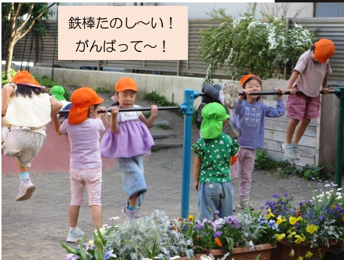
鉄棒たのし～い！ がんばって～！