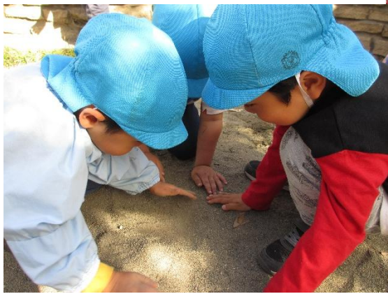
みんなで何を探してるんだろうな～