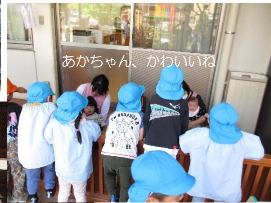
あかちゃん、かわいいね